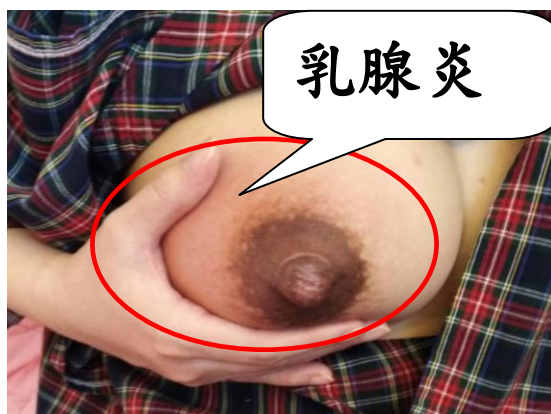
(圖片已經當事人同意)